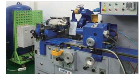
电主轴锥孔专用磨床

The charts show only an extract of available motor configurations for IBAG motor spindles. Do you wish an alternative motor spindle or a customized solution? Feel free to contact us.